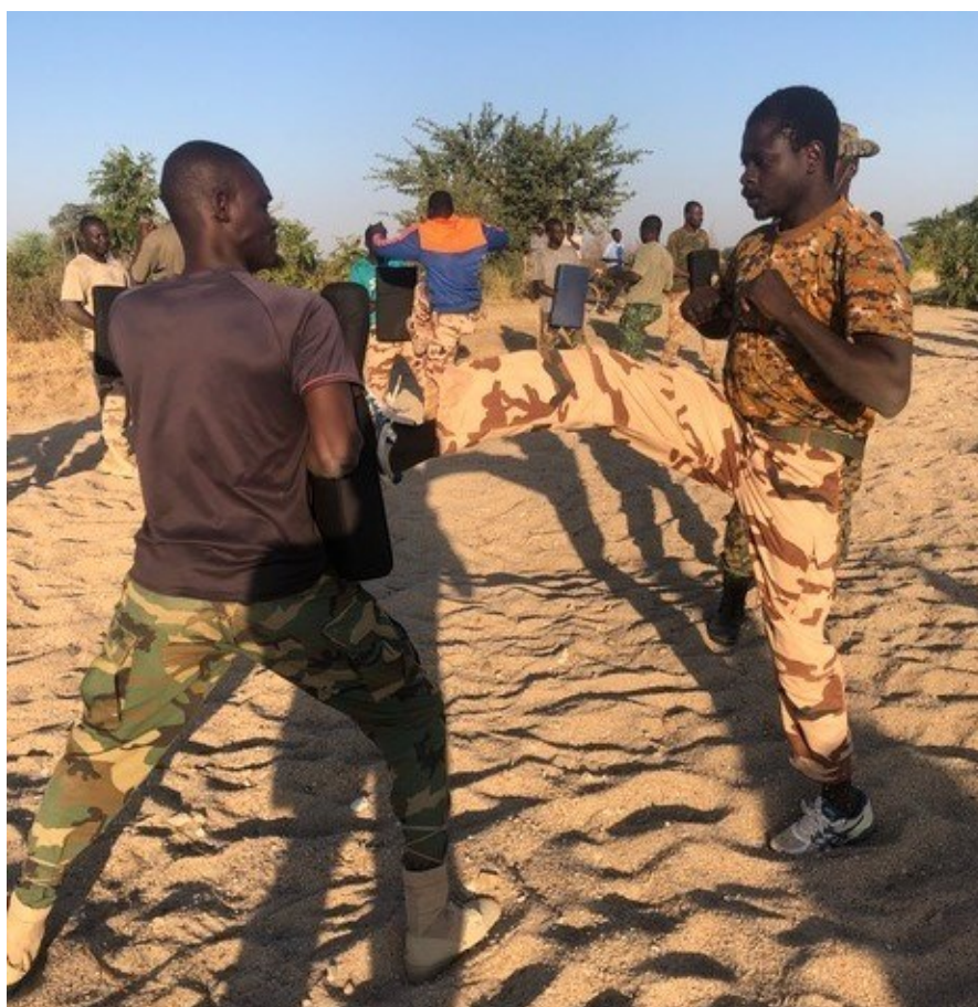
Figure 4 : Formation des gardes au CAPBL, novembre 2022

Pendant ce semestre les TdR pour une expertise senior de formation ont été validés par le CTR et la mission lancée le 25 octobre 2022.