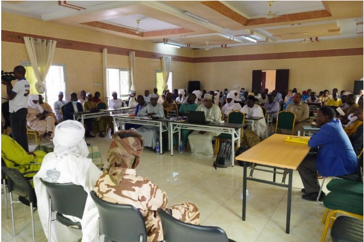
Figure 2 : Le premier atelier consultatif tenu à Mongo en février 2022 pour la préparation du SPAT du Guera

d'utilisation des terres du GEFZ afin de fixer les priorités, le zonage et les règles dans cet espace tant pour les gestionnaires de l'aire protégée que pour les autorités et partenaires. Pour soutenir cette approche, APEF a prévu une mission pour la préparation des Schémas provinciaux du Territoire (SPAT) pour les provinces du Guera et du Salamat, où se trouve le GEFZ. L'objectif principal de cette mission était de doter chacune des provinces du Guéra et du Salamat, d'un outil de planification territoriale à l'échelle provinciale afin de faciliter les opérations d'aménagement et de développement et permettre la mise en cohérence intersectorielle des actions de développement au niveau du GEFZ.