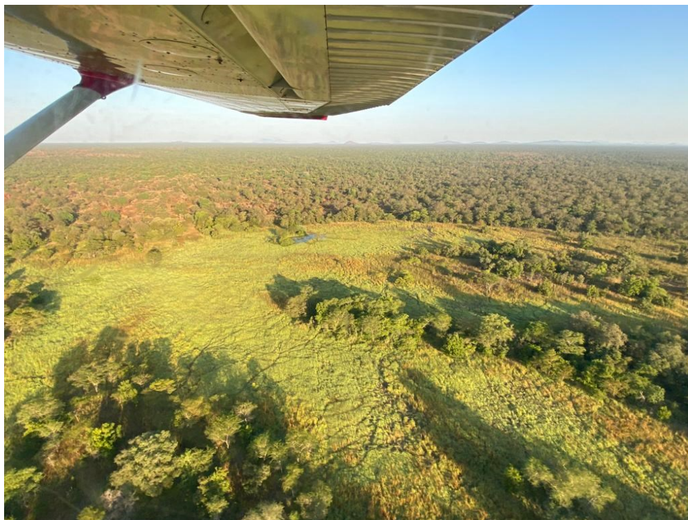
Figure 5 : Vue aérienne du domaine de chasse de Roukoun, novembre 2022

Cette expertise sera menée par un expert senior qui sera accompagné lors des déplacements sur le terrain par deux cadres du MEPDD et un cartographe. La prise en charge des cadres du MEPDD et du cartographe sera assurée par la CN APEF. La mission se déroulera entre janvier et avril 2023. Les TdR de cette mission ont été validés par le CTR et l'expert recruté. Le démarrage de la mission a été postposé à janvier 2023 en raison d'une saison des pluies exceptionnelle en 2022 qui a occasionné de nombreux dégâts dans le DC de Roukoun et nécessité des travaux urgents de remise en état, ne permettant pas l'appui logistique indispensable à la mission avant début 2023.