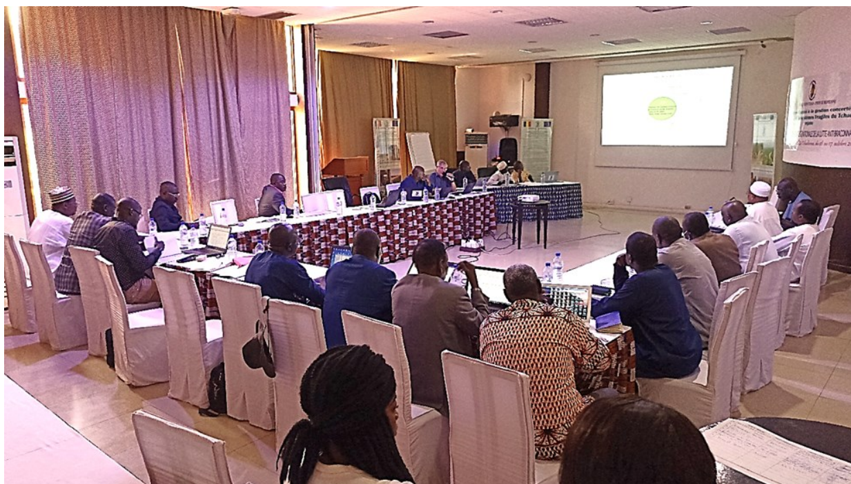
Figure 1 : Les participants à l'atelier de validation de la stratégie nationale LAB, N'Djamena

Les 3 axes se déclinent ensuite en 14 Programmes et 41 Actions, listées par niveau de priorité (élevée, moyenne, faible) et où les acteurs principaux et associés responsables de leur mise en œuvre sont identifiés.