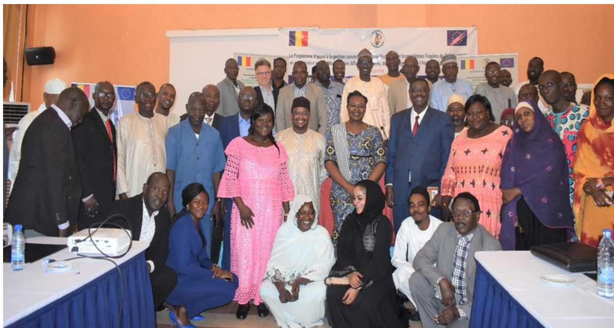
Figure 3 : Atelier national de validation des SPAT Guera et Salamat à N'Djamena le 27-29 septembre 2022

chaque province, à Mongo et à Amtiman, avec une très large participation des acteurs étatiques, des partenaires et de la société civile.